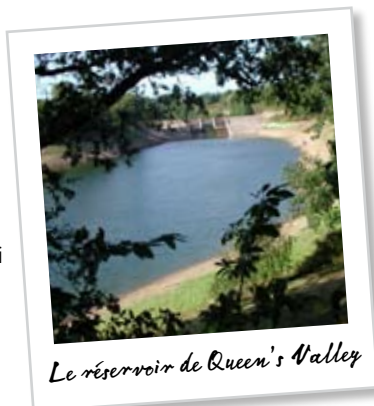
Le réservoir de Queen's Valley

Continuez le long du bord du terrain commun, ou le long de la plage si vous préférez, jusqu'au parking qui se trouve de l'autre côté du pavillon entouré de douves (Fort William). La Pierre de Millénium, une de douze pierres offertes comme don à chaque paroisse et érigée par le Jersey Field Squadron en l'an 2000, se trouve près d'ici en haut des dunes de sable.